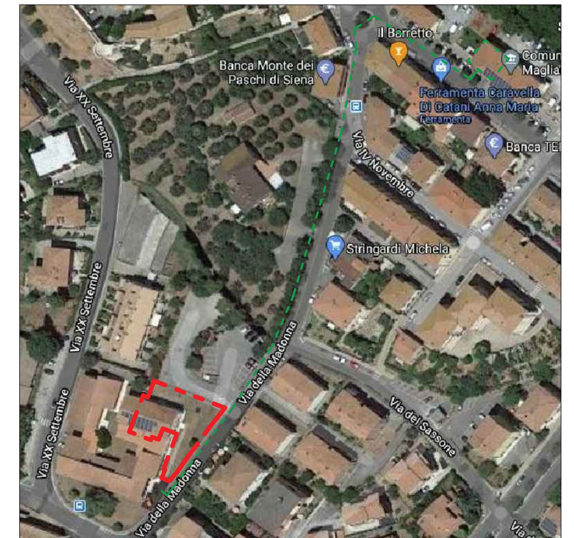
Indicazione del percorso per raggiungere l'area alternativa, da utilizzare in caso di maltempo - Scala 1:1000